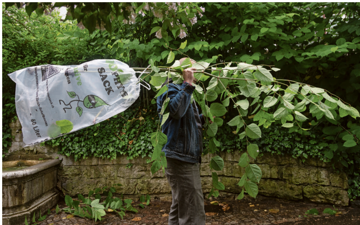
Der korrekte Umgang mit dem Japanischen Staudenknöterich.

Wer im Garten bisher ein Berufkraut fand, war also bisher angehalten, es für 2.30 Franken in einem «Böcklisack» entsorgen zu lassen. Ab sofort gibt es eine bessere Option: den Neophytensack. Er kann kostenlos am Infoschalter im Stadthaus oder im Blumenladen von Grün Schaffhausen bezogen werden und wird mit der regulären Kehrtafelabfuhr entsorgt. Imi.