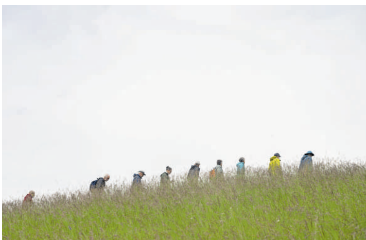
Die botanische Fachgruppe der SHnat.

RANDENBOTANIK Während vielerorts in der Schweiz Böden zunehmend überdüngt, dunkler – oder gar vollständig überbaut werden, widersetzt sich der Schaffhauser Randen diesem Trend: Hier finden sich noch immer magere, warme und helle Standorte. Diese besonderen Bedingungen bieten zahlreichen Pflanzenarten ideale Lebensräume. Unterwegs mit der botanischen Fachgruppe der Naturforschenden Gesellschaft Schaffhausen in Merishausen.