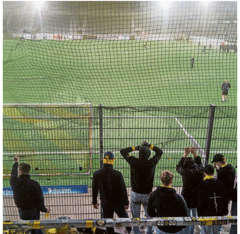
Verzweifelte Fans am Spiel des FCS gegen Nyonnais.