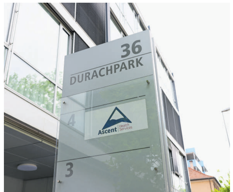
Der Hauptsitz von Ascent.