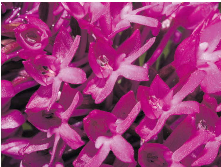
Anacamptis pyramidalis .