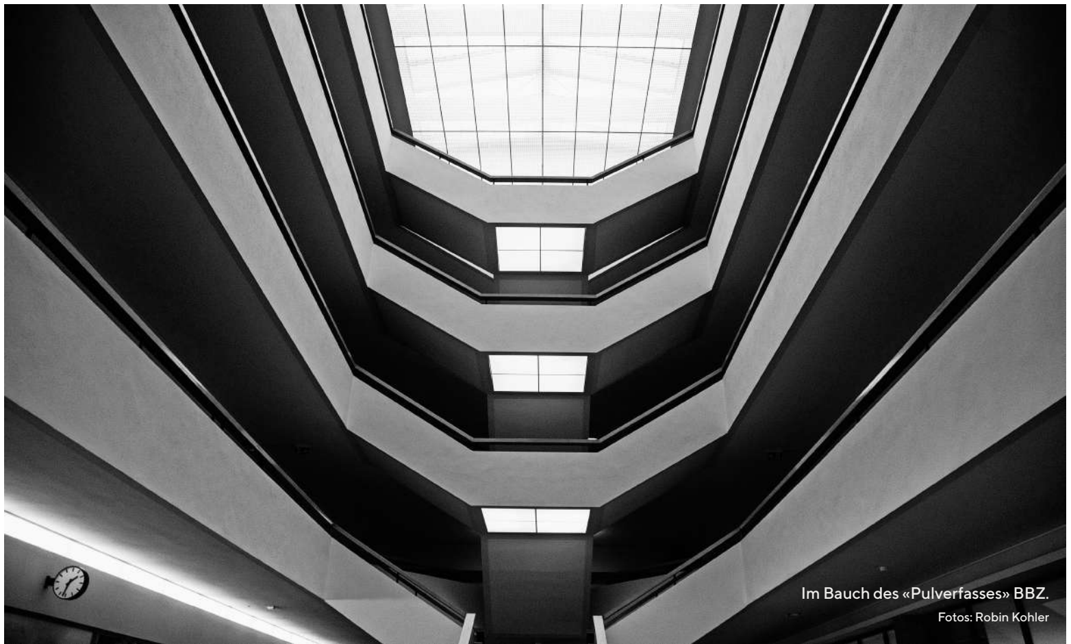
Im Bauch des «Pulverfasses» BBZ.