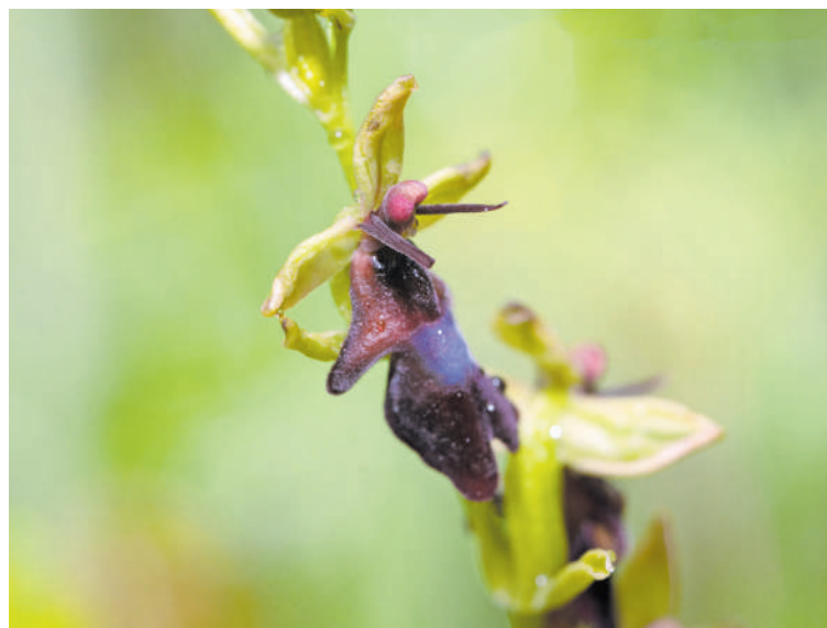
Ophrys insectifera .