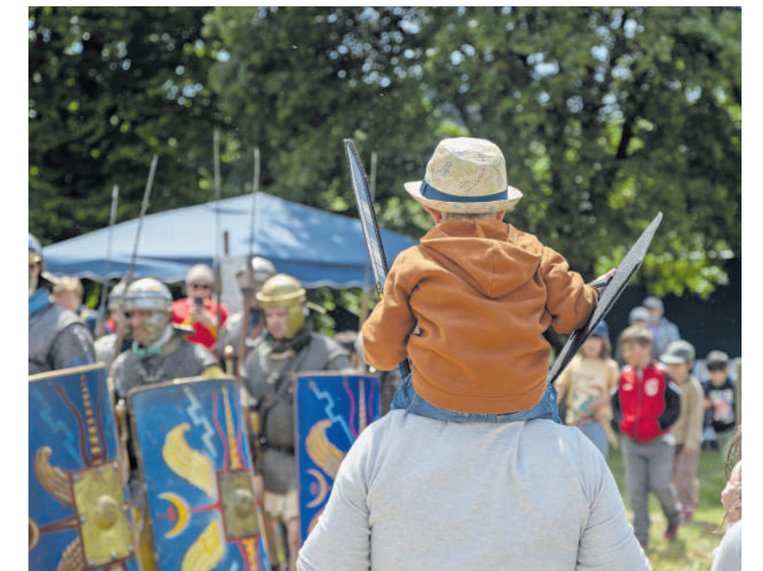
Rechts: Ein angehender Legionär mit Schwert und Schild verfolgt den Marsch der neunten Legion aus Vindonissa.