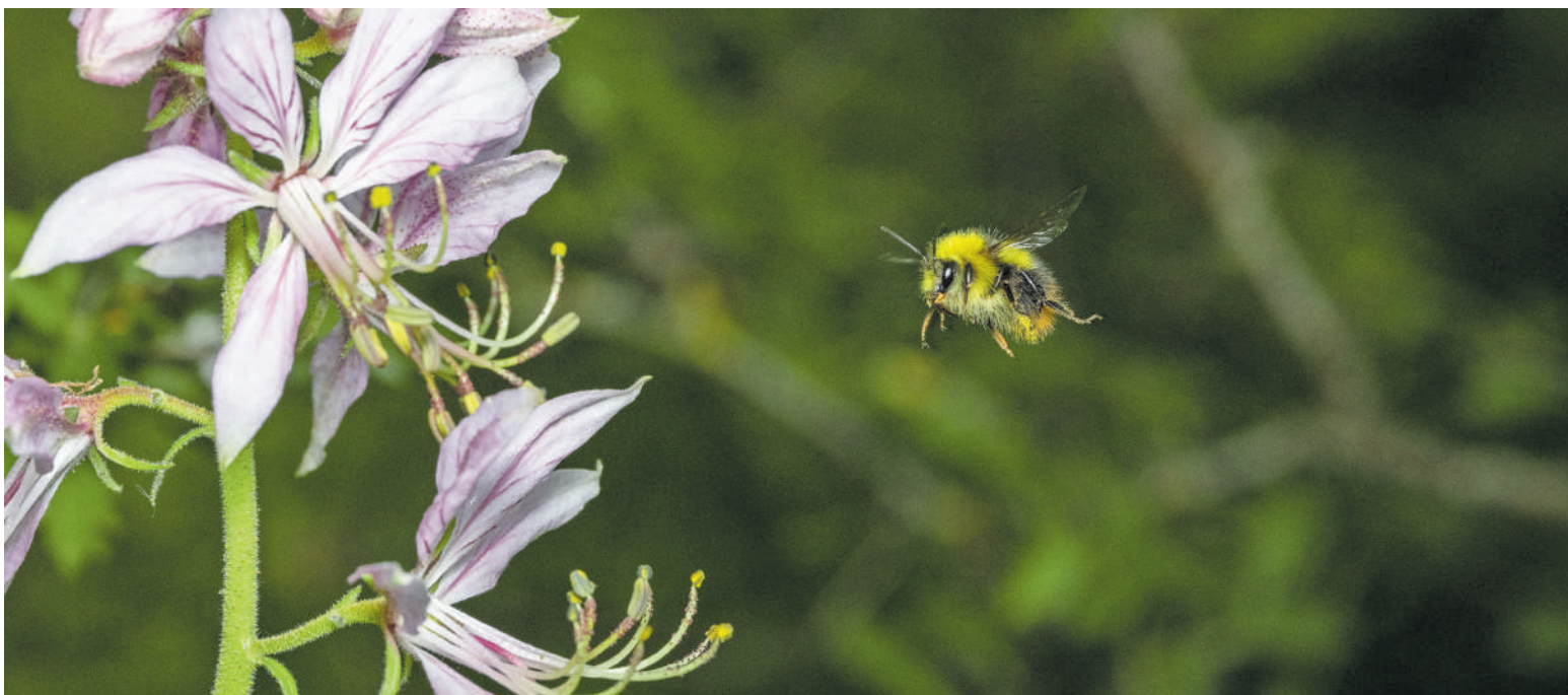
Eine Hummel fliegt einen Diptam ( Dictamnus albus ) an.