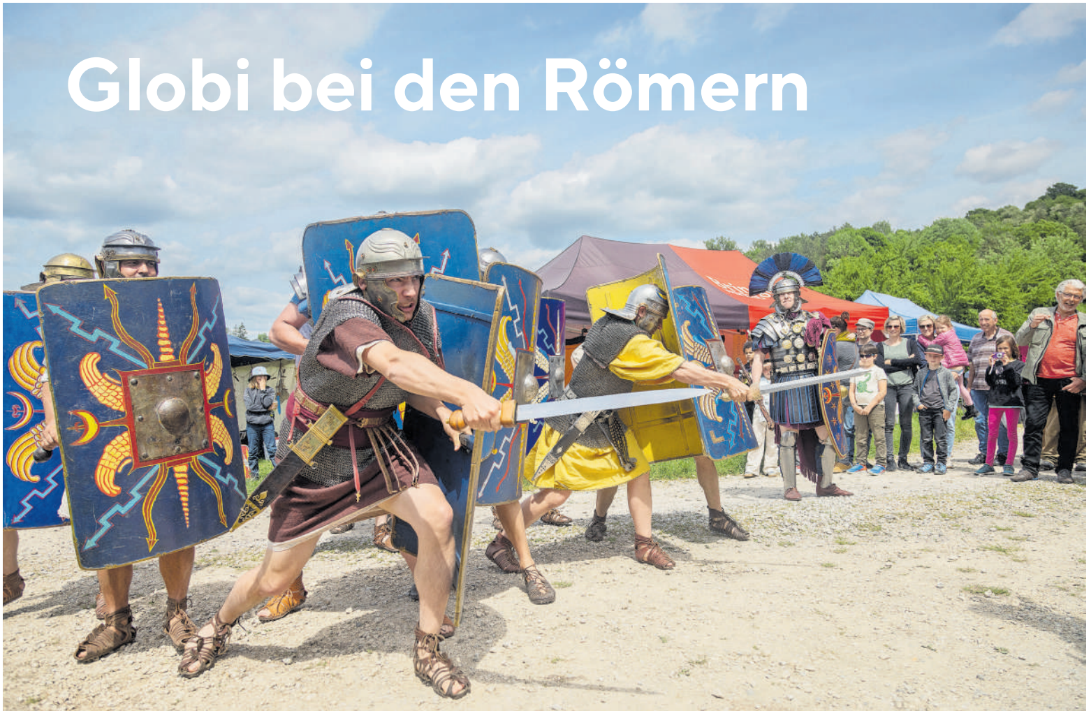
Die Helvetier hatten vor 2000 Jahren keinen Stich gegen diesen Move der neunten Legion.