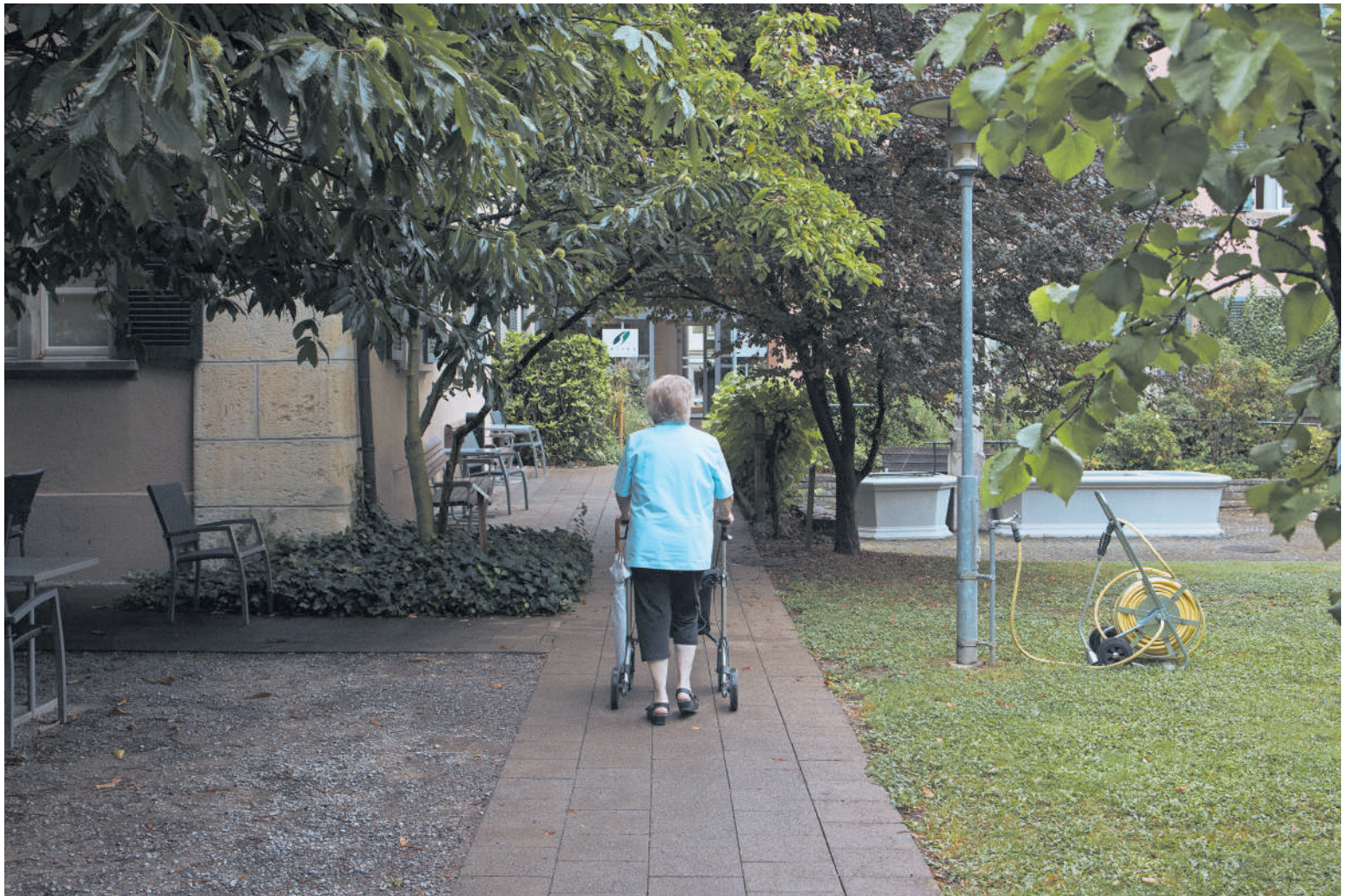
Durch die steigenden Altersheimkosten könnten künftig viele ältere Menschen auf Unterstützung angewiesen sein.