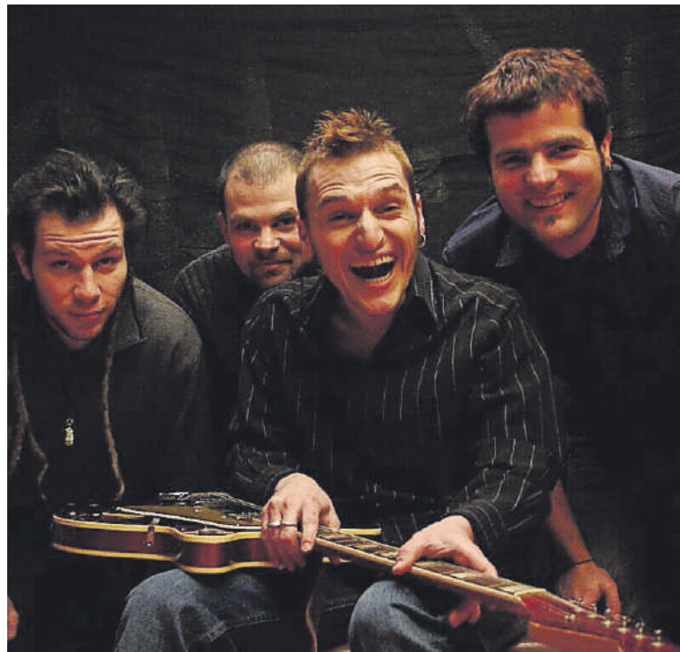
Die Thurgauer «Ashtrays» gibt es bereits seit den Neunzigern.

KONZERT: FR (22.8.), 18.30 UHR, REIATBADI (THAYNGEN).