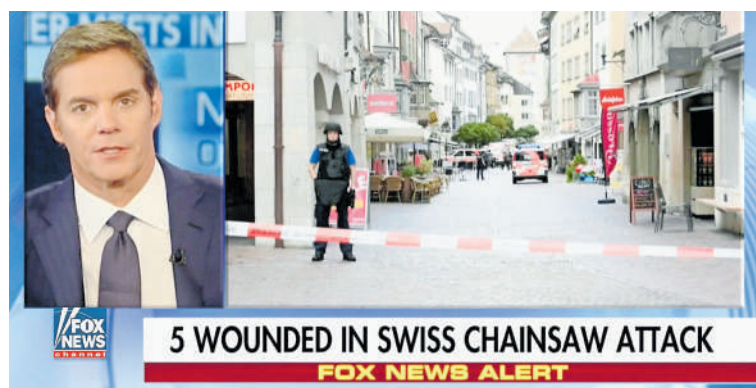
Vom Guardian bis zu Fox News berichteten alle vom Kettensägenangriff in Schaffhausen.

«Ich habe es verstanden, aber kann es nicht nachvollziehen.»