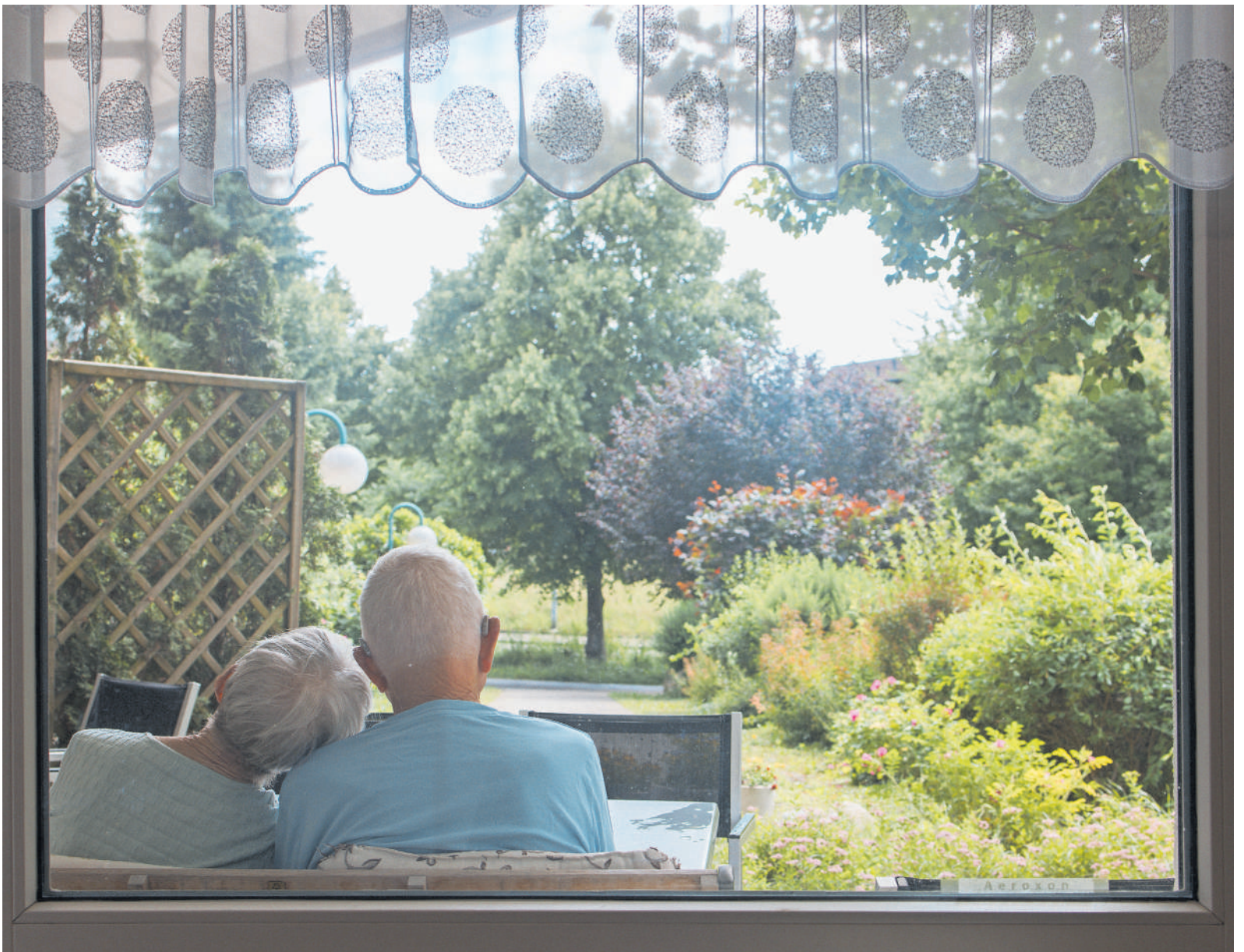
VERLIEBT Frühlingsgefühle im Lebensherbst und Hochsommer.