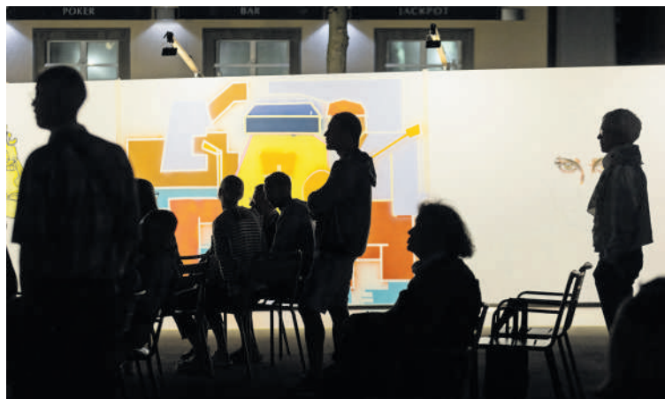
Nonstop Kultur gab es an den Kulturtagen 2023.